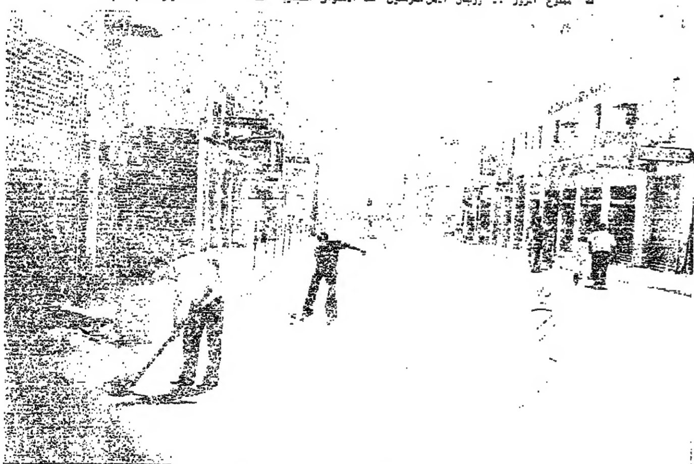
■ عمال التنظيفات ينظفون شارع المرقي